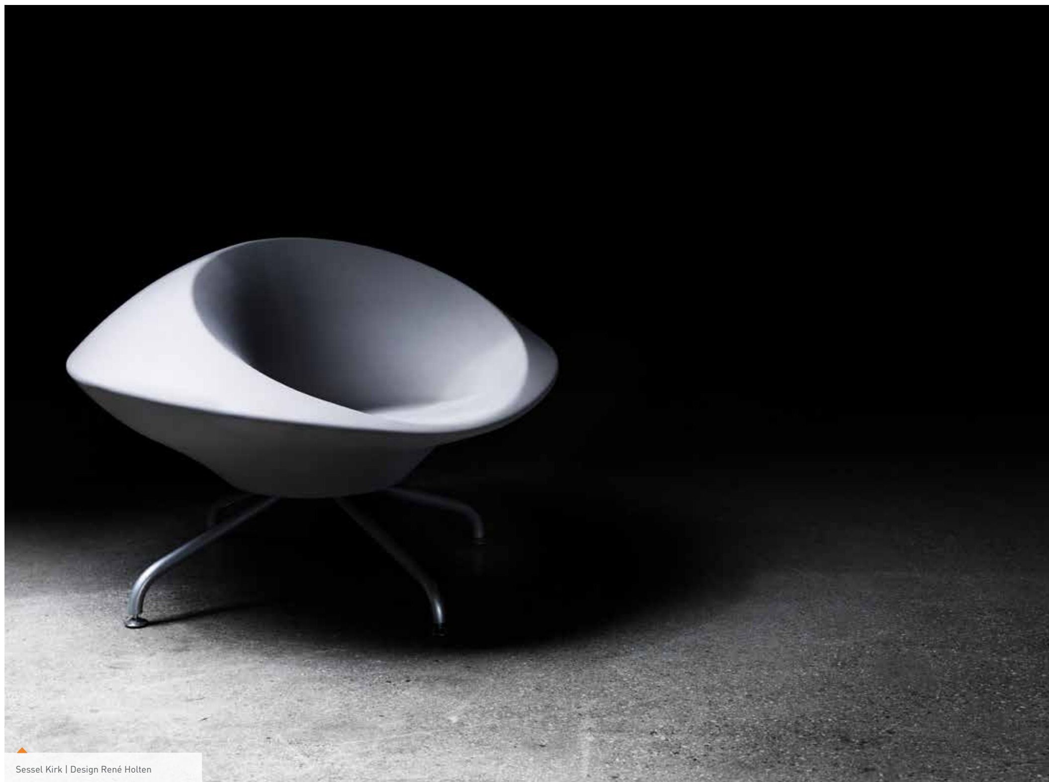
Sessel Kirk | Design René Holten