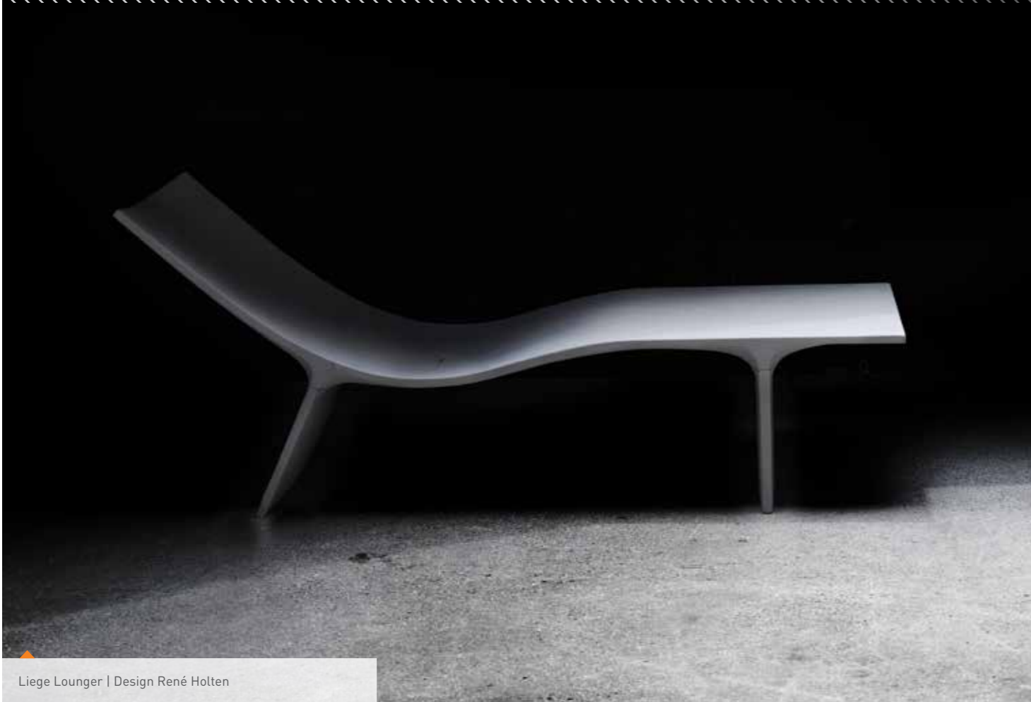
Liege Lounger | Design René Holten