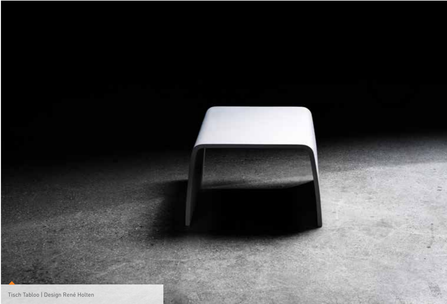
Tisch Tabloo | Design René Holten