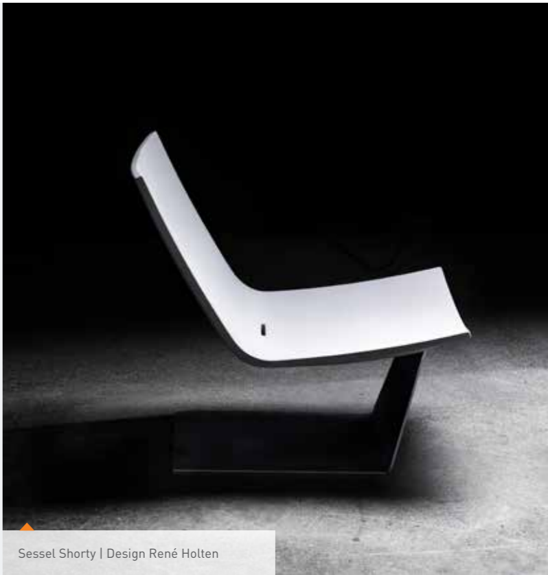
Sessel Shorty | Design René Holten